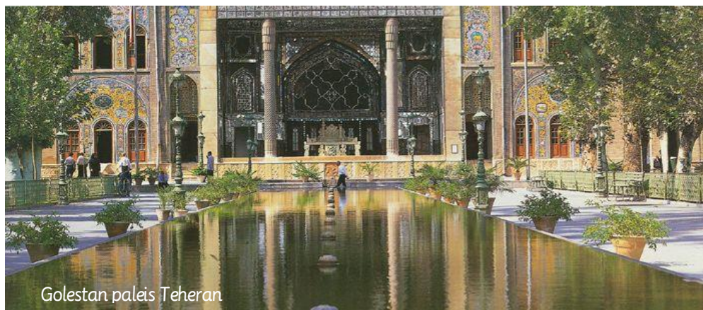
Golestan paleis Teheran

Persepolis, was de glorieuze hoofdstad van het Perzische Rijk. Ze is gesticht door Darius de Grote en door Xerxes verder voltooid. Het complex omvatte 12 gebouwen, een paleis, een audiëntiehal, een harem en een schatkamer. In 330 voor Christus werd de stad door legers van Alexander de Grote geplunderd en verwoest.