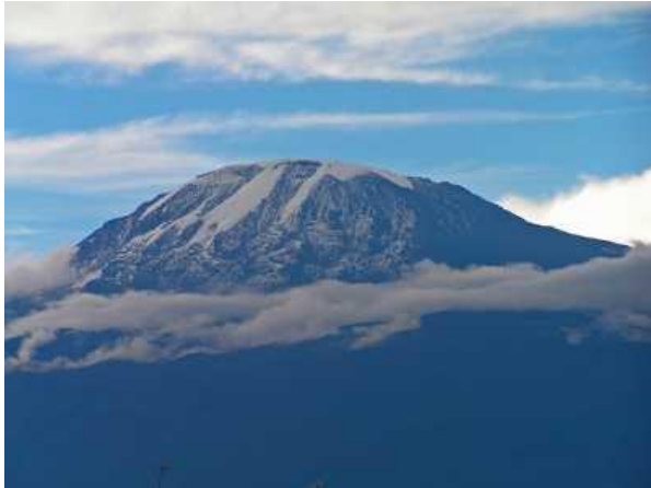
Moshi kilimajaro gebergte in Tanzania